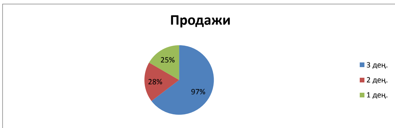
Рисунок 2. Показатели знаний студентов по «тактика и этапы педагогической поддержки профессионального самоопределения учащихся»

можно выполнить в качестве профессионального консультанта? Зачем использовать разговорный метод в консультировании? С какой целью проводятся поездки, встречи в профориентации? Используя анкету, вы определили личность клиента. Каковы ваши дальнейшие действия? Какова конечная цель формирования профессионального самоопределения? Объясните свои отношения с учеником, которому трудно выбрать профессию? Как сформировать у учащихся, испытывающих трудности с выбором профессии, уверенность в своем саморазвитии? Как защитить ученика от неприятной (неблагоприятной, сложной) ситуации при выборе профессии? Волнующий вопрос у ученика: «кем я буду?». Вас попросили о помощи. Каковы ваши действия? Сущность педагогической поддержки? Каковы способы содействия профессиональному саморазвитию учащегося?