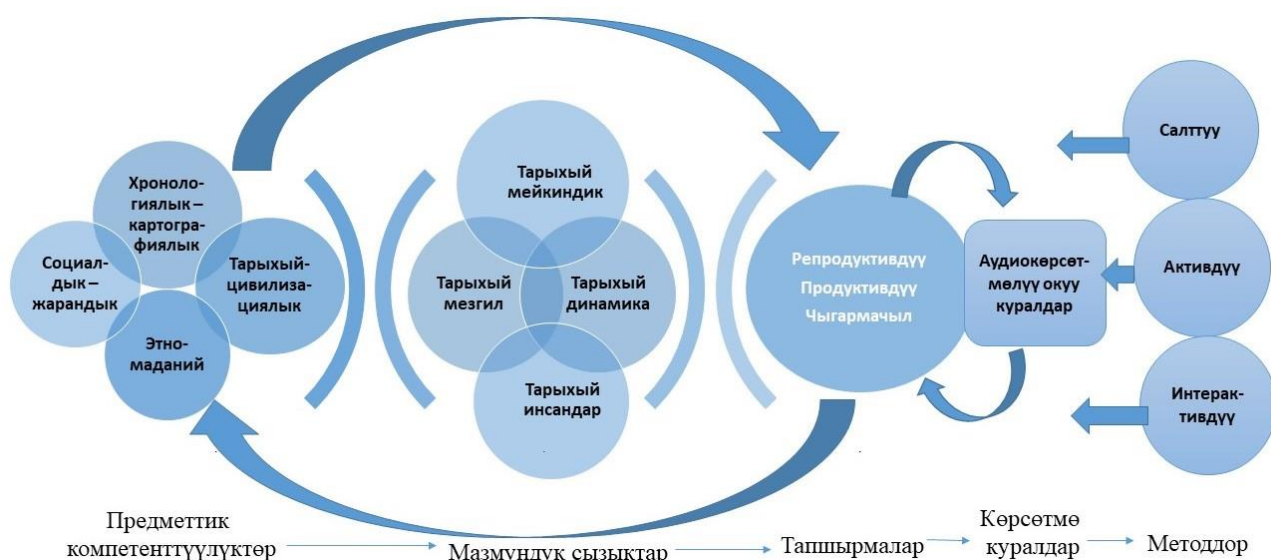
1-сүрөт. Тарых предметинин мазмунун түзүүнүн биз сунуштаган схемасы

Үчүнчү этапта, мугалимдер Кыргызстан тарыхы курсунун компетенттүүлүккө негизделген оптималдуу мазмунун сынап көрүштү. Мазмун биз сунуштаган критерийлерди (1-тиркеме) эске алып, компетенттүүлүккө негизделген Кыргызстан тарыхы курсунун оптималдуу мазмунунун моделинин (2-тиркеме) негизинде түзүлдү жана ар бир предметтик компетенттүүлүктүн калыптангандыгын сынаган деңгээлдик тапшырмалар менен коштолду.